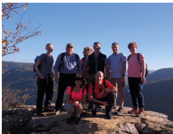
Wandertour nach Bad Urach