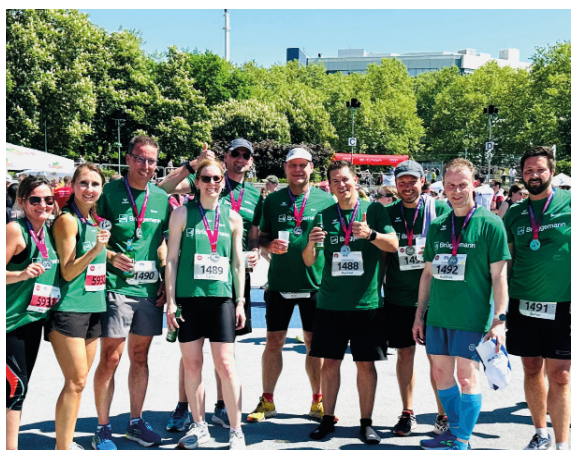
Trollinger Marathon 2025