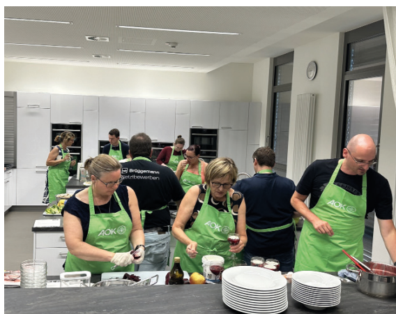
AOK Kochkurs 2025